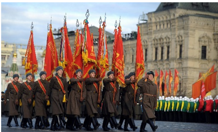
Сегодня в честь исторического военного парада проводится торжественный марш

С 2003 года в Москве на Красной площади ежегодно в честь исторического военного парада красноармейцев 7 ноября проводится торжественный марш с участием ветеранов Великой Отечественной войны, курсантов военных училищ, школьников, студентов и различных творческих и патриотических коллективов. По традиции, одной из кульминационных точек является небольшая театрализованная инсценировка, а в заключении — праздничный концерт для ветеранов.