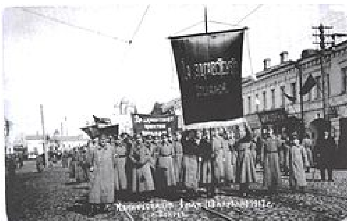
Демонстрация 1 мая 1917 года в Пскове

В Российской империи Первое мая как день международной солидарности трудящихся впервые отметили в 1890 году в Варшаве проведением стачки 10 тыс. рабочих. С 1897 года маёвки стали носить политический характер и сопровождались массовыми демонстрациями. Первомайские выступления рабочих в 1901 году в Петербурге, Тбилиси, Гомеле, Харькове и др. городах впервые сопровождались лозунгами: «Долой самодержавие!», «Да здравствует республика!», столкновениями с войсками (например, т. н. «Обуховская оборона» 1901 года).