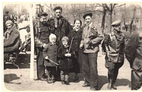
1 мая 1941 г. Москва, Чистые пруды

После Октябрьской революции 1917 года праздник стал официальным. В СССР первоначально он назывался «день Интернационала», позднее он стал называться «День международной солидарности трудящихся — Первое Мая» и отмечаться 1 и 2 мая. 1 мая в Советском Союзе был нерабочим днём с 1918 года согласно Кодексу законов о труде РСФСР, 2 мая — с 1928 года согласно постановлению ЦИК СНК СССР «О праздничных днях, посвященных дню Интернационала, и об особых днях отдыха» от 23 апреля того года. 1 мая проводились демонстрации трудящихся и военные парады (первый первомайский парад РККА состоялся в 1918 году на Ходынском поле). На второй день праздника, как правило, во всей стране проходили «маёвки» — массовые празднования на природе.