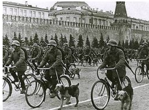
Велосипедные военные собаководы. Парад 1 мая 1938